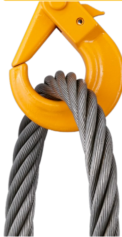
钢铁制 钢丝绳吊具 重量 43kg