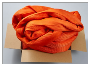
KITO旧款 环形纤维吊带RE形