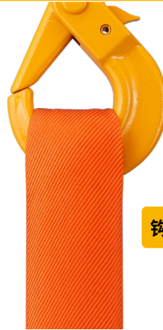
KITO旧型号 环形纤维吊带RE形 重量 20.5kg